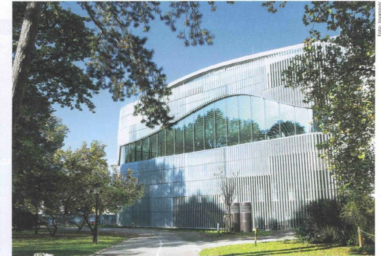
Das gesamte Gebäude ist ein monolithischer Block, der sich in zwei Abschnitte aufteilt. Der introvertierte und durch die Keramikklammelfassade schwer einsichtige, zweigeschossige Sockel bildet das Kurhaus. Darüber befinden sich Badehalle, Saunalandschaft und Ruheräume.